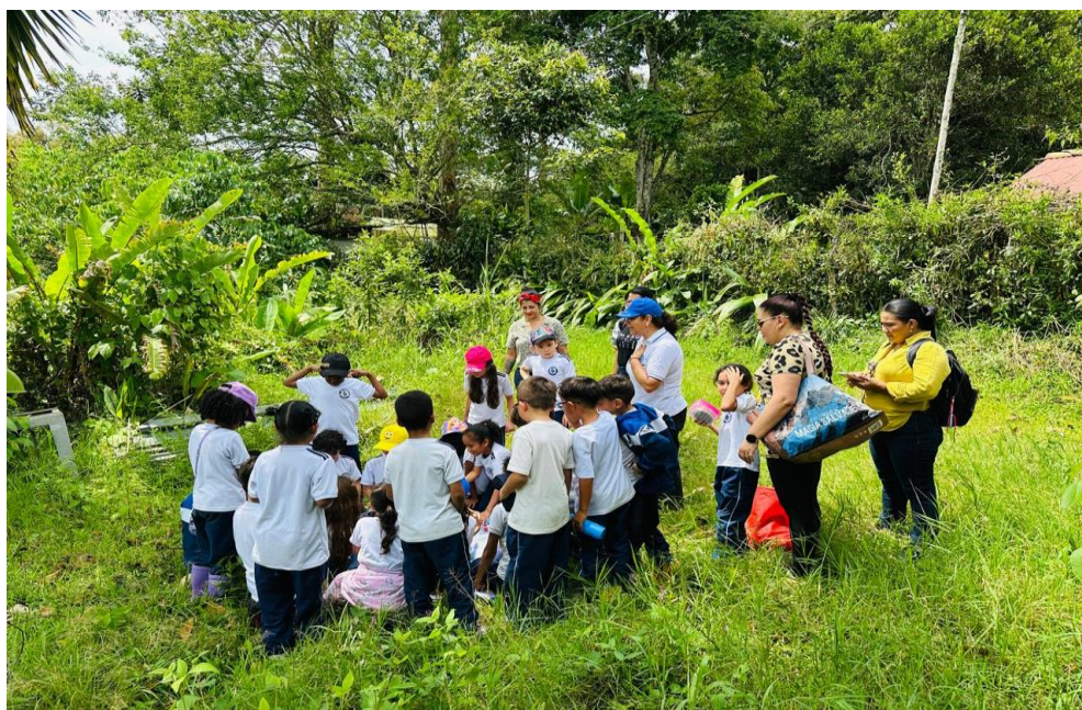
Visita grado 2A a la finca

file:///C:/Users/olgac/Downloads/Olimpiadas-de-Literatura-I.E.-Marcelino-Champagnat-2026.pdf